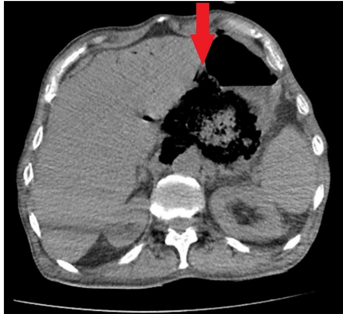
Şekil 2 : Batın Bilgisayarlı Tomografisi; Özofagogastrik bileşkede hava dansitesi ile genişleme izlendi(kırmızı ok).