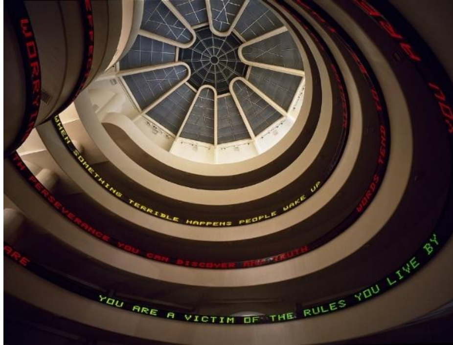
Resim 13. Truisms Serisinden, Solomon R. Guggenheim Müzesi New York, Amerika, Foto: D. Heald, 1989

Holzer hem iç hem de dış mekânların yanı sıra kentsel ve kırsal ortamlarda zaman zaman diğerlerinden ödünç alınmış metinleri de yansıtmıştır. Sanatçı, Nobel Ödüllü Polonyalı Şair Wlslawa Szymborska'nın bir dizi şiirini projeksiyonlarla kullanarak sergilemiştir ki Polonyalı şair de Holzer'a benzer şekilde şiirlerinde politik ve ahlaki konuları ele almaktadır. Bazı yazıların tavanlara kadar ulaşmasından dolayı sergi salonlarına izleyicilerin metni daha rahat okumaları için puf benzeri koltuklarla oturma alanları oluşturulması da ihmal edilmemiştir (Resim 12).