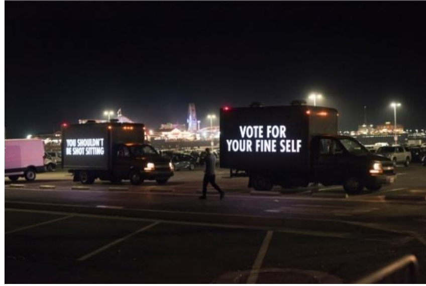
Resim 15. "Vote For Your Future" Serisinden, Amerika, 2018

Ayrıca 2020 yılının son çeyreğinde Amerika için önemli bir viraj olan seçimlerle ilgili de boş durmayan sanatçı, daha fazla demokratik katılım ve seçmenlerin yetkilendirilmesi için ülke çapındaki "YOU VOTE (OY VER)" kampanyasını birçok farklı sanatçı ile birlikte yürütmüştür. İmza blok metin stilinde "VOTE FOR YOUR LIFE (HAYATINIZ İÇİN OY VERİN)" ve "BE MY ALLY (MÜTTEFİKİM OL)" gibi ifadeler içeren kampanyanın en önemli parçası hem bir sanat eseri hem de bir seçmen bilgi merkezi olarak işlev gören LED kamyon filosudur. Florida, Pennsylvania ve Wisconsin gibi genel olarak büyük seçim çekişmesine sahip sallantılı eyaletler olarak kabul edilen bölgelerde bu filo caddelerde görülmüştür (Resim 15).