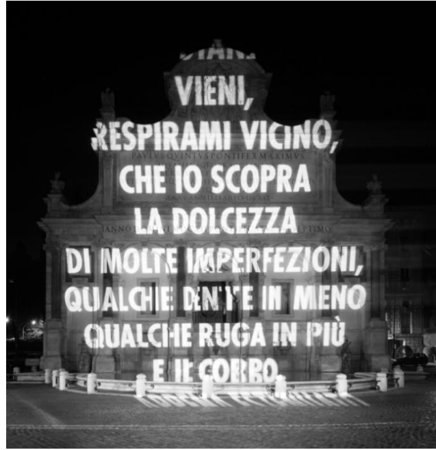
Resim 11. Lontano, Şair Patrizia Cavalli