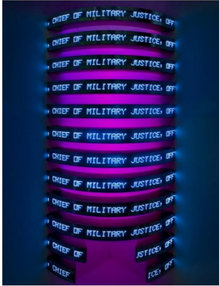
Resim 14. "A.B.D. Hükümeti Dokümanları" New York, Amerika, Foto: C. Burke, 2008

Soyutlanmış bir göğüs kafesini andıran Holzer'ın LED kurulumunu andıran "Torso" adlı eseri ise çeşitli suçlarla itham edilen askerlerin dava dosyalarındaki ifadelerini, soruşturma raporlarını ve e-postalarını içermektedir. Renk olarak kırmızı, mavi, beyaz ve mor ışıktan oluşan bir iskelet çevresinde sabitlenmiş on yarım daire şeklindeki şeritler, sürekli olarak bahsi geçen yazıları sergilemektedir (Resim 14).