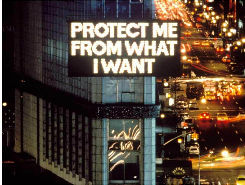
Resim 6. Survival Serisinden New York Times Meydanı Amerika, 1983

Bunun yanı sıra parketreler, kapı eşikleri, telefon kabinleri gibi kentsel peyzajın tüm özelliklerini sahne malzemesi olarak kullanmıştır. Tekrar belirtilmesi gerekir ki çeşitli bağlamlarda yazıtlar bazen bir isyan ya da yıkıcılık duygusunu da ifade etmektedir. Yine aynı yıl "PROTECT ME