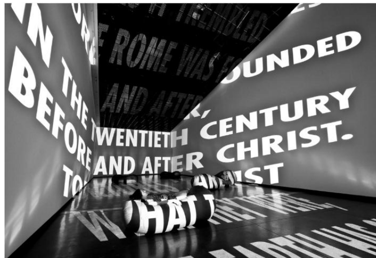
Resim 12. "İşkenceler" Wisława Szymborska'nın Kum Tanesi Görüntüsü'nden, Modern Sanatlar Merkezi Melbourne Avusturalya, Foto: C. Cappuro, 2019

Burada oluşan eylemsel sürecin teknoloji bağlamında Holzer'la ne kadar bütünleşmiş olduğunun ve çalışmalarını disiplinler arası temele uygulayabildiğinin altı çizilmelidir. Bu metinsel dilin insanlarla paylaşılması üzerine sanatçı, "Bir metin, olağandışı bir şey söylüyorsa insanlar bunu fark eder." diyerek sanat yaklaşımını bu düşünce yapısı üzerine temellendirmiştir (Soran Gumpert, 2002: 85). Holzer'ın kentsel-kamusal alanın nasıl kullanılabileceği ve kullanılmakta olduğu konusunda her zaman oldukça hassas olmasının nedeni de tam olarak budur. Bundan dolayı birçok şehrin önemli yapılarına akşamları yansıtma işlerinden metinler ve şiirler paylaşmaktadır (Resim 11). Glueck onun için "Teknoloji kullanımındaki kolaylık, seçkinci olmayan yaklaşımı, gelenek karşısındaki sabırsızlığı ve kitlelere erişme arzusuna bürünmüş bir sanatçı" olduğunu düşünür. (Barret, 2012: 133)