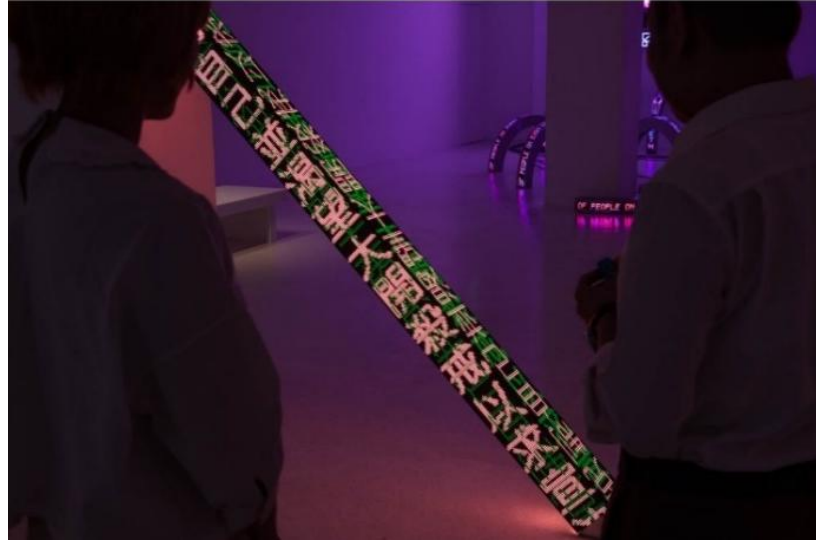
Resim 9. Survival Serisinden, Pearl Ham Galerisi Hong Kong, Foto: C. LaFleche, 2017

Jenny Holzer'ın dil üzerindeki bu güçlü ifadeleri, insanları müşkül durumlarını kabul etmeye zorlarken aynı zamanda insanoğlunun düştüğü ortak yaşam sorunsallarını yansıtmayı amaçlamaktadır. Dolayısıyla mesajların gücü insanın zayıflıklarını ifade ederken izleyicilerin de kendince belirsiz yorumlamalar yapmalarını sağlar. Ancak bu yorumlamalar içerisinde asla bir cevap elde edilemez. Bu metinler salt dünyevi durumlar için bir ışık niteliği taşımaktadır (Barret, 2012: 133). "Peki yaşadığımız bu dönemde Jenny Holzer'ın bu manifestolarının bir hakikati var mıdır? Siyasette, sanatta ya da insan yaşamında yeri olur mu? Zamanımızda nasıl anlamlandırılır?" (Artun, 2010: 63) diye sorulacak olursa dünya üzerinde yaşanan adaletsizlik, siyasi ve cinsel şiddet, ölüm, keder ve öfke gibi durumların varlığı onun bu makalelerinde haklılık payının olduğunu göstermektedir. Ayrıca metnin izleyiciye nasıl hitap ettiğine, aynı zamanda resimden çok daha erişilebilir olabileceğine dikkat çekerek, "İnsanlar mücadele edebilir ve resimden korkabilir, ancak dil hemen eriştikleri bir şeydir." ifadesiyle de yaşadığı dönemde sanatının nasıl anlamlandırabildiğinin farklı bir tavrını ortaya koymaktadır. (Holzer,2009: 4;; Papastergiadis, 2016: 18) Ancak dil, Holzer için yalnızca tekil bir araç değildir. Önemli olan onun yerleştirildiği yüzeylerdir, yani yazının niteliği kendi içeriğiyle olduğu kadar yerleştirildiği yüzeyin bağlamı ile de tanımlanır (Kılınç, 2019: 148) (Resim 8).