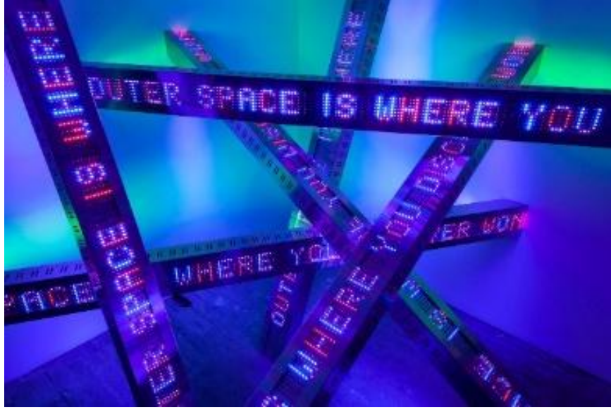
Resim 1. "Yığın", Survival (Hayatta Kalan) Serisinden, Foto: C. LaFleche, 2013