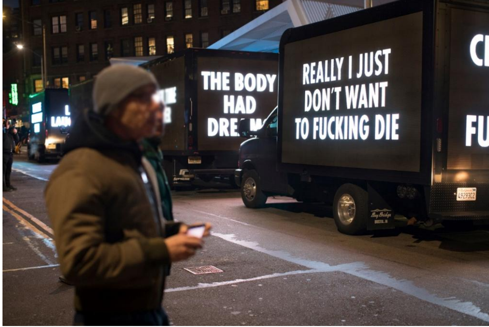
Resim 17. Light the Fight (Kavgayı Aydınlat) Serisinden, Dünyanın Yükü: David Wojnarowicz'in kayıtlarından, Foto: S. Speranza, 2018

Benzer temayı 2018 yılında öğrencilerin silah kontrolü taleplerini desteklemek amacıyla silah karşıtı propaganda yazılarıyla desteklediği kamyonları Amerika'nın birçok şehrinde gezinmiştir. (Resim 16) Yine 2018'de Dünya AIDS Günü kapsamında bir dizi metinleri aynı filo teması üzerinden Amerika'nın birçok noktasında sergilemiştir (Resim 17).