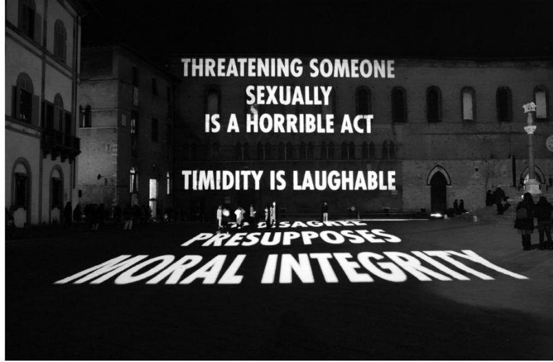
Resim 4. Maria della Scala Müzesi İtalya, Truisms (Gerçekler) Serisinden

uzaklaşma tekniklerini kullanarak tabiri caizse izleyicileri dev yansımalarla hipnotize etmeye, onları sarsmaya ve şok etmeye çalışmaktadır. Buradaki amaç ki diğer bir deyişle idealist bir hedef, kitlelere ilham vermek ve bir bakıma onları kışkırtmaktır (Resim 4) (Soran Gumpert, 2002: 81).