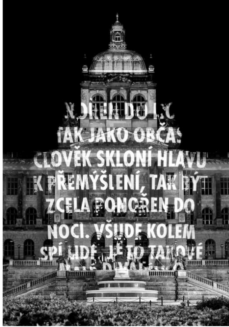
Resim 10. "Gece", Franz Kafka'nın Kısa Hikayelerinden, Çek Cumhuriyeti / Prag, 2009

Holzer açtığı birçok sergide, eski serilerinden seçmece makalelerini kullanmayı tercih etmiştir. Bunun yanı sıra 2004'ten beri ABD'den gizliliği kaldırılmış bazı hükümet belgelerindeki verileri sergilerine dâhil ederek sanatsal söylemini resmi kaynaklarla da güçlendirmiştir. Holzer sanat anlayışında, acı, aşk, barış ve hayatta kalma gibi mihenk taşı olarak belirlediği temaları işlemesine ek olarak, zaman zaman yazar ve şairlerce üretilen yazın türlerini de eserlerine dâhil ederek kendi teknik tarzının dışına çıkmadan yenilikler yapmıştır. (Resim 10).