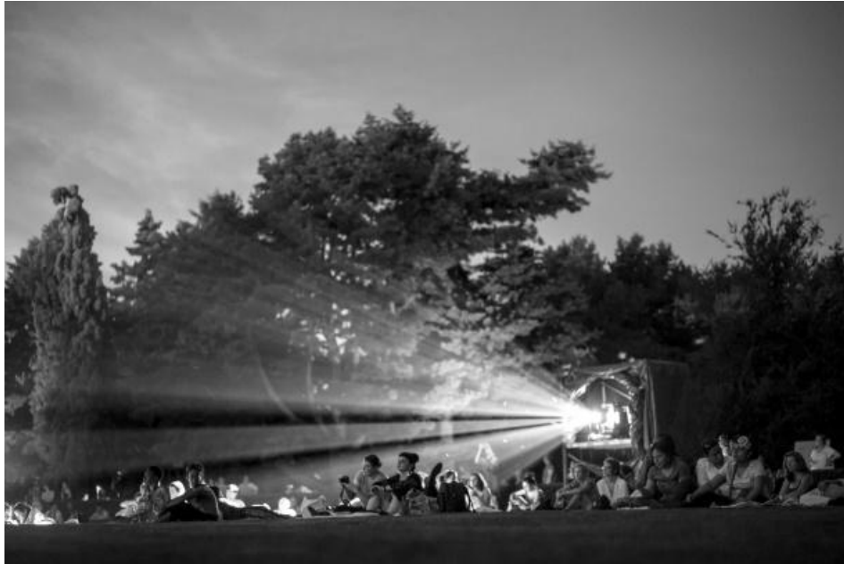
Resim 2. Jenny Holzer'ın Eserlerini Yansıtan Dev Projeksiyon, New York Botanik Bahçesi