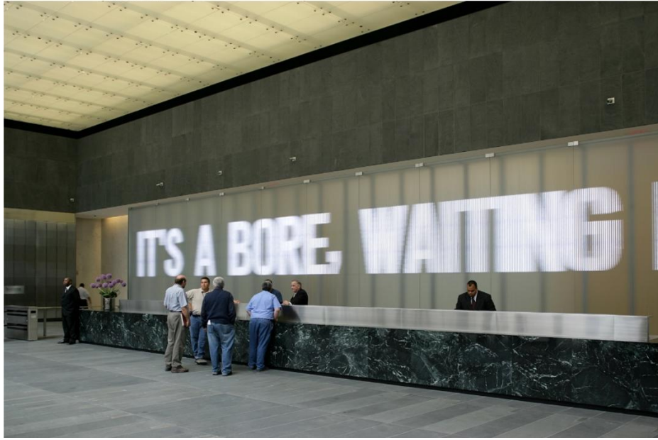
Resim 3. Hudson Ferry'nin Derlenen Şiirlerinden, Dünya Ticaret Merkezi Amerika, 2006

Kavramsal sanat ifade dilinin en uç noktasını temsil ederken eylemin düşünce ve söyleyle olan gelişiminin incelenmesini amaçlamaktaydı (Demir Bağatır, 2011; 30). Ancak kavramsal sanat felsefesinde özellikle ön plana çıkan “estetik düzenin reddi” yaklaşımı, Holzer’ın elektronik çalışmaları ile farklı bir boyuta taşıdığı fikri üzerinde durmaktadır. Çünkü kökeni ve oluşum amacı olan estetiğin reddi ile kurgulanan eserlerin aksine, Holzer’ın LED ışıklar ve projeksiyon tekniklerini kullanarak oluşturduğu ürünler izleyicilerine devasa görsel bir şölen sunmaktadır (Resim 3 ve 4).