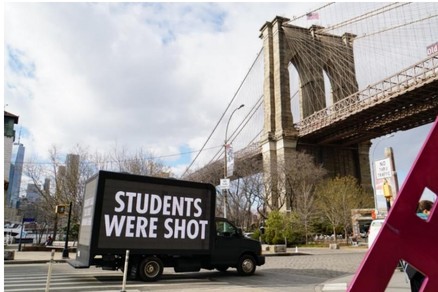
Resim 16. It Is Guns Serisinden, New York, Foto: P. Kamuf, 2018

Ayrıca 2020 yılının son çeyreğinde Amerika için önemli bir viraj olan seçimlerle ilgili de boş durmayan sanatçı, daha fazla demokratik katılım ve seçmenlerin yetkilendirilmesi için ülke çapındaki "YOU VOTE (OY VER)" kampanyasını birçok farklı sanatçı ile birlikte yürütmüştür. İmza blok metin stilinde "VOTE FOR YOUR LIFE (HAYATINIZ İÇİN OY VERİN)" ve "BE MY ALLY (MÜTTEFİKİM OL)" gibi ifadeler içeren kampanyanın en önemli parçası hem bir sanat eseri hem de bir seçmen bilgi merkezi olarak işlev gören LED kamyon filosudur. Florida, Pennsylvania ve Wisconsin gibi genel olarak büyük seçim çekişmesine sahip sallantılı eyaletler olarak kabul edilen bölgelerde bu filo caddelerde görülmüştür (Resim 15).