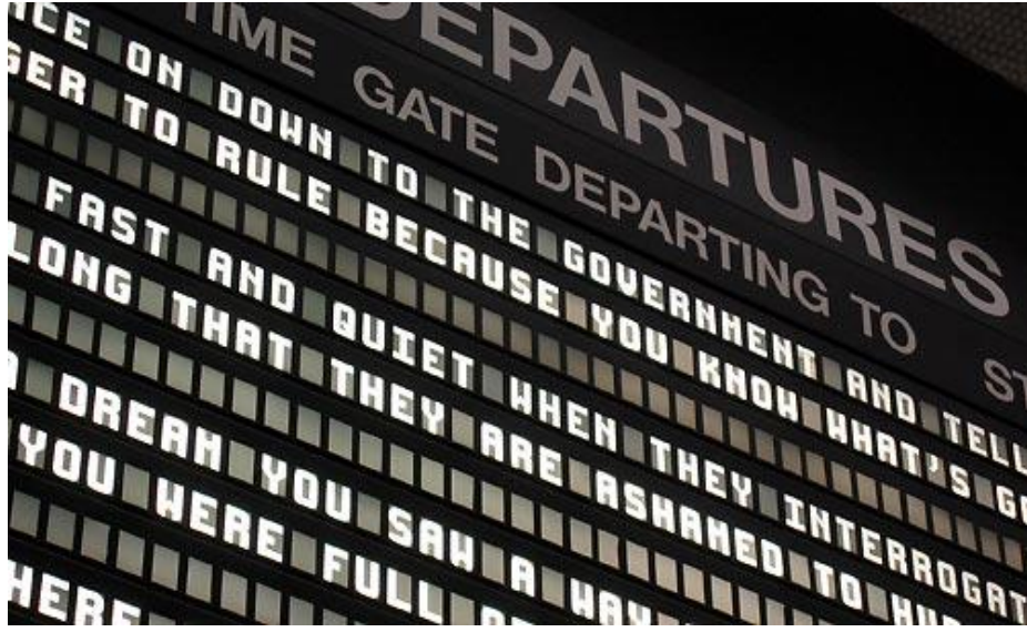
Resim 7. Terminal V Sergisi, J.F.Kennedy Havaalanı Bilgilendirme Panosu, New York, 2004

FROM WHAT I WANT (BENİ İSTEDİĞİM ŞEYDEN KORU)" adlı çalışması, medya kentindeki arzu ve tüketimin kısır döngülerinin parodisini ironik bir şekilde ele almaktadır.