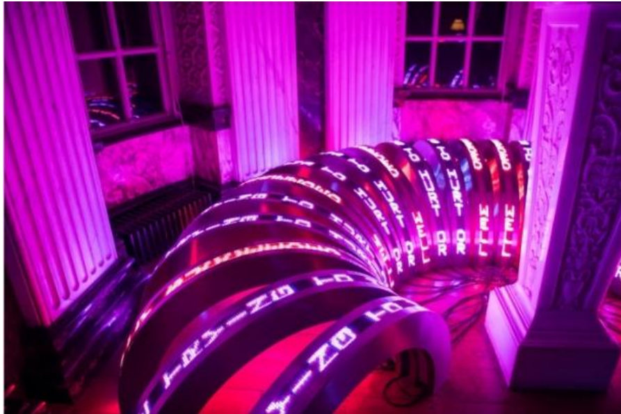
Resim 8. "Blenheim İçin" "Eski ve Yeni İngiliz Askerleri ile Görüşme Metni" Blenheim Sarayı, İngiltere, 2017

Holzer, dev tabela veya panoların bıraktığı büyüleyici etkilerin yanı sıra gündelik alanda sade ve bilgilendirici amaçla kullanılan sistemleri de metinleri için kullanmıştır. Zira "Terminal Five" adı altında birkaç sanatçı ile John F. Kennedy Havaalanı'nda sergilenen billboard eseri buna en iyi örnektir. Burada özellikle eski havaalanlarında daha sık rastlanan retro ve mekanik görünümlü ekranda zaman çizelgesi üzerine de yazılar yazmıştır (Resim 7).